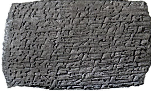
Kültepe-Kaniş (Kayseri) ören yerinde bulunan ve Asur halkından bir kişinin kardeşine yazdığı mektubu gösteren kil tablet, MÖ 1920-1740, British Museum, Londra

Geçmişten günümüze kadar binlerce yazılı belge ulaşmasına rağmen Anadolu'da Hititlerden önce meydana gelen tarihi olaylar ve siyasi gelişmeler hakkında kapsamlı bilgi edinilememiştir. Bununla birlikte Kültepe-Kaniş ören yerinde yapılan kazılarda Asurlu tüccarların ticari faaliyetleriyle ilgili çok sayıda tablet bulunmuştur. Bu tabletlerde tüccarlar, sadece kendi faaliyetleriyle ilgili bir problem yaşadıklarında siyasi ya da sosyal konulara değinmiştir. Bu bilgiler de ancak şehirde isyan çıktığı, taht kavgası yaşandığı, kralın öldüğü ya da tahta çıktığı, salgın bir hastalığın baş gösterdiği gibi yüzeysel ve kronolojik olmayan haberlerden ibarettir.