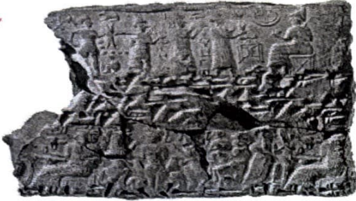
Kültepe-Kaniş (Kayseri) ören yerinde bulunan, Anadolu ve Eski Asur üslubunda yapılmış ve dört adet silindire mühürlenmiş çivi yazılı bir zarfı gösteren kil tablet, MÖ XX-XIX. yüzyıl, Metropolitan Museum, New York

S-6 Bu tarih araştırmasında yararlanıldığını düşündüğünüz bilim dallarından 5 tanesini aşağıdaki tablo üzerinde işaretleyiniz? (10 Puan)