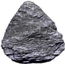
Görsel 2.1: Tarih öncesi devirlerde, günümüzden yaklaşık 600.000 yıl önce yaşayan insanların kullandığı ilk taş aletlerden biri

Metni ve görselleri inceleyerek soruları cevaplayınız.